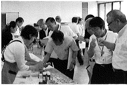
審査会風景＝商工会議所会議室

六月六日（木）、地域資源を生かした特産品の開発や生産技術の向上、地場産業の振興を図るため、南さつま市・南さつま市観光協会・当所の共催で「南さつま市ふるさと産品コンクール」（協賛：公社）鹿児島県特産品協会・（公社）鹿児島県観光連盟・南さつま市議会・南さつま市商工会）が開催され、南さつま市内の事業所十五社から三十一名の出品がありました。審査会には県特産品協会や県観光連盟、市内関係者など十五名の審査員があたり、出品事業者に製品の特徴やセールスポイントなどをたずねて、試食・試飲をしながら、「地域資源等の活用・創意工夫・売れ行きの期待度」などの項目について厳正な審査が行われ、下記のとおり結果となりました。