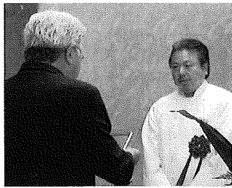
鳥越会頭より会頭賞の授受 ＝商工会議所会議室

六月六日（木）、地域資源を生かした特産品の開発や生産技術の向上、地場産業の振興を図るため、南さつま市・南さつま市観光協会・当所の共催で「南さつま市ふるさと産品コンクール」（協賛：公社）鹿児島県特産品協会・（公社）鹿児島県観光連盟・南さつま市議会・南さつま市商工会）が開催され、南さつま市内の事業所十五社から三十一名の出品がありました。審査会には県特産品協会や県観光連盟、市内関係者など十五名の審査員があたり、出品事業者に製品の特徴やセールスポイントなどをたずねて、試食・試飲をしながら、「地域資源等の活用・創意工夫・売れ行きの期待度」などの項目について厳正な審査が行われ、下記のとおり結果となりました。