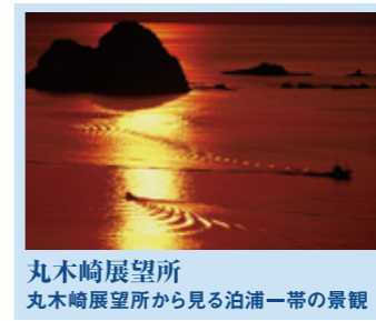
丸木崎展望所 丸木崎展望所から見る泊浦一帯の景観