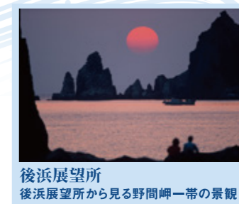
後浜展望所 後浜展望所から見る野間岬一帯の景観