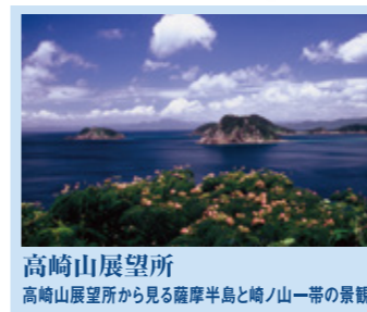
高崎山展望所 高崎山展望所から見る薩摩半島と崎ノ山一帯の景観

「南さつま海道八景」は、南さつま市を通る国道226号の沿線から眺望できる、自然景観や文化遺産などの八つの景観のことです。心ゆくする絶景が待っています。(※写真:「南さつま海道」とは226「フォトコンテスト」入賞作品より)