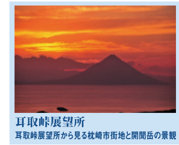
耳取峠展望所 耳取峠展望所から見る枕崎市街地と開聞岳の景観