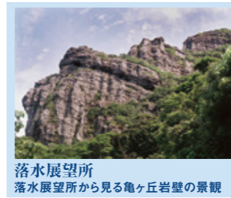
落水展望所 落水展望所から見る亀ヶ丘岩壁の景観