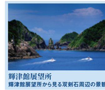
輝津館展望所 輝津館展望所から見る双剣石周辺の景観