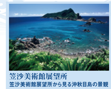
笠沙美術館展望所 笠沙美術館展望所から見る沖秋日島の景観