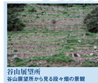
谷山展望所 谷山展望所から見る段々畑の景観